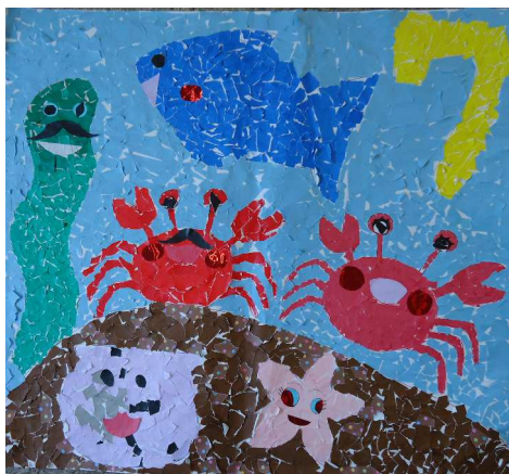
一番左は、ウツボじゃありません、海藻です(^ ^)

カープの“神がかり”連勝や受診や抜歯や散髪等々、それぞれの日々のできごとの報告を聞きながら、いつもどおり、和気あいあいと過ごしました(^o^)